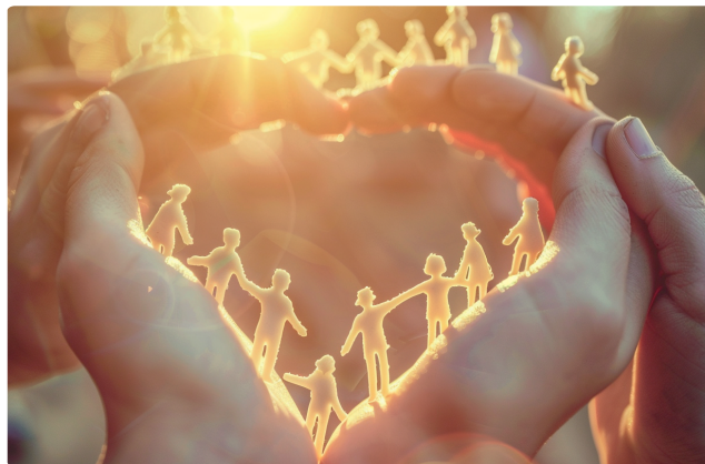
Zustiftungen zu Lebzeiten