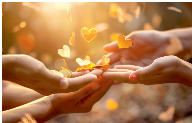
Direkte Spenden für laufende Projekte